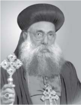
Late Archbishop Servant of God Geevarghese Mar Ivanios